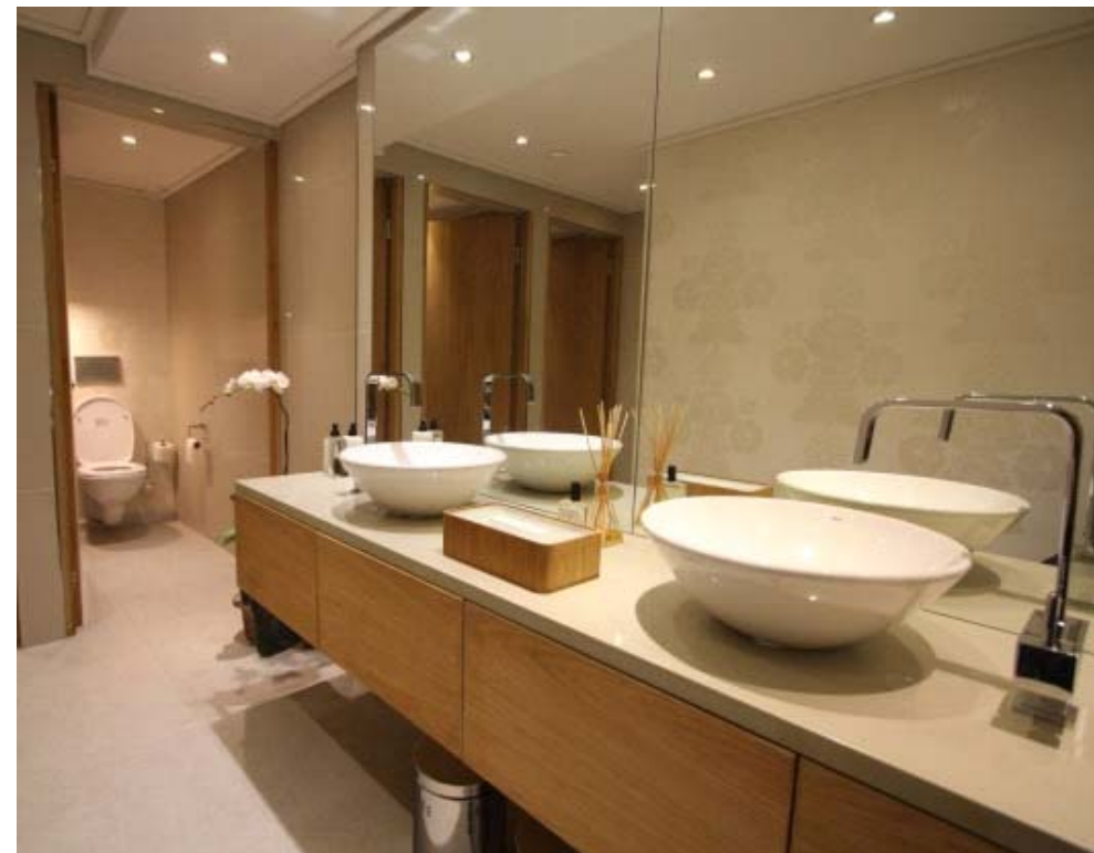
空間示意圖(替選方案) A3=1/80 cm